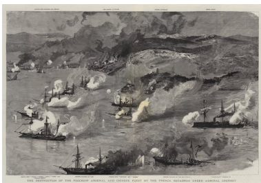
The Destruction of the Foochow Arsenal and Chinese Fleet by the French Squadron under Admiral Courbet , par Joseph Nash le jeune. Illustration pour le journal The Graphic , 18 octobre 1884.

Le conflit s'intensifie et prend une dimension maritime. L'amiral Courbet prend la tête de l'escadre d'Extrême-Orient. En août 1884, la flotte du Fujian et l'arsenal de Fuzhou – construit par le Français Prosper Giquel – sont anéantis en trente minutes.